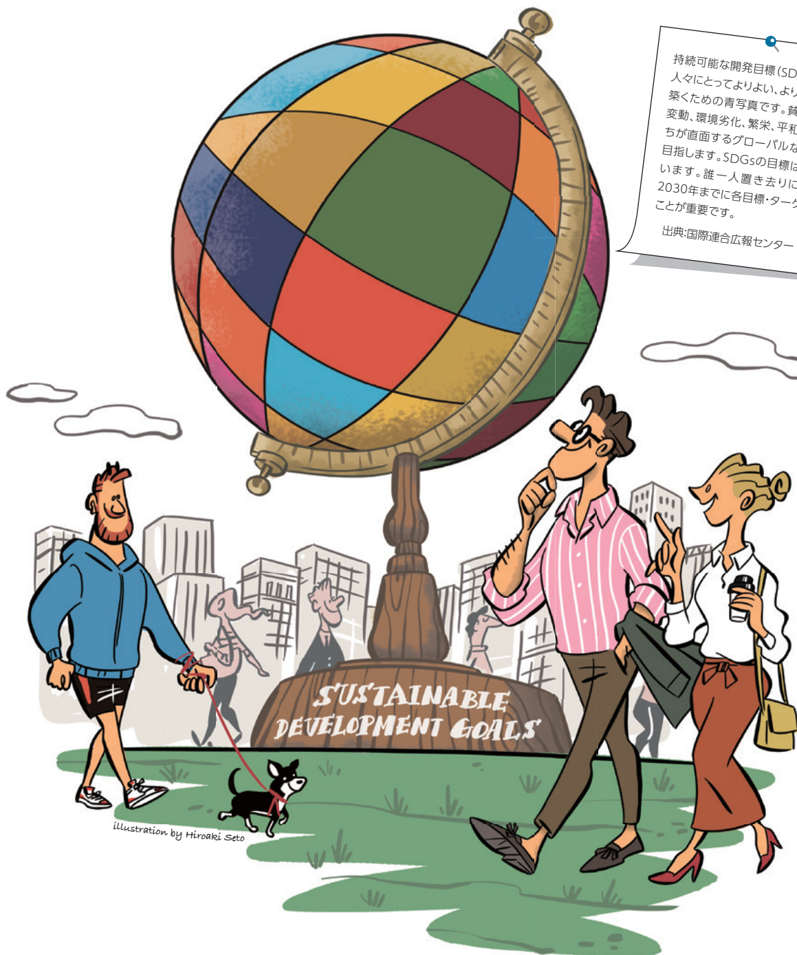
illustration by Hiroaki Seto