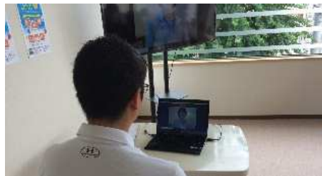
オンライン健康相談