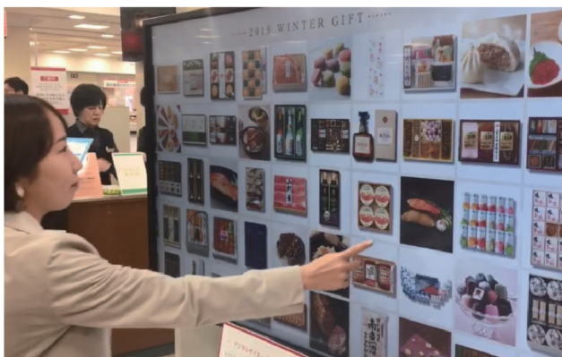
三越伊勢丹ギフトセンター

～中元歳暮ギフトセンターにおけるリアルとデジタルの融合、華やかな演出、話題喚起～