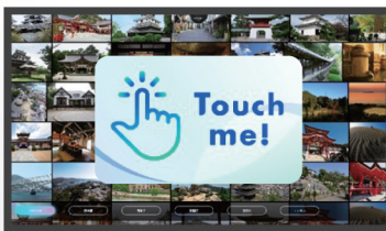
①待機画面 待機画面ではタッチを想起させるアニメーションを表示