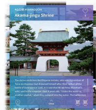
③コンテンツ詳細画面 画面をタッチすると詳細情報を表示