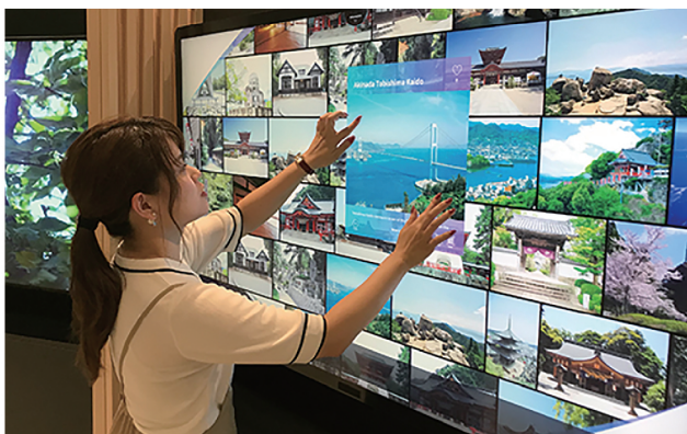
広島空港 1F国際線到着ロビー