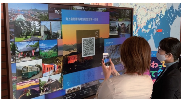
大和ミュージアム